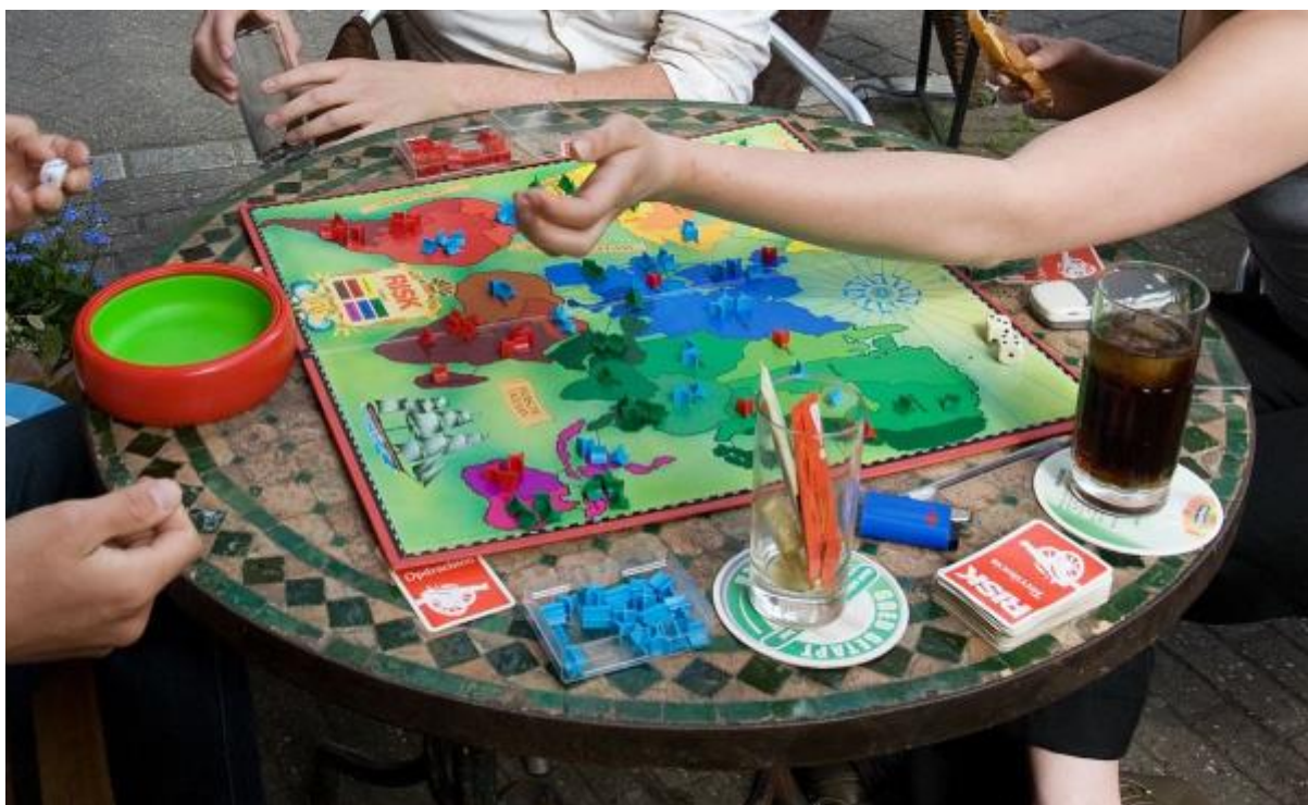
1 кл. Игра "Определи маршрут Деда Мороза"