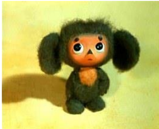
2 - Комната 1. Чебурашка

Дальше путь Деда Мороза определите сами.