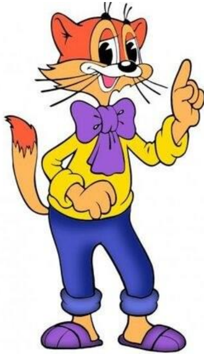
9 - Комната 6. Кот Леопольд