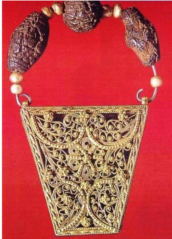
4 - Золото подарили волхвы.