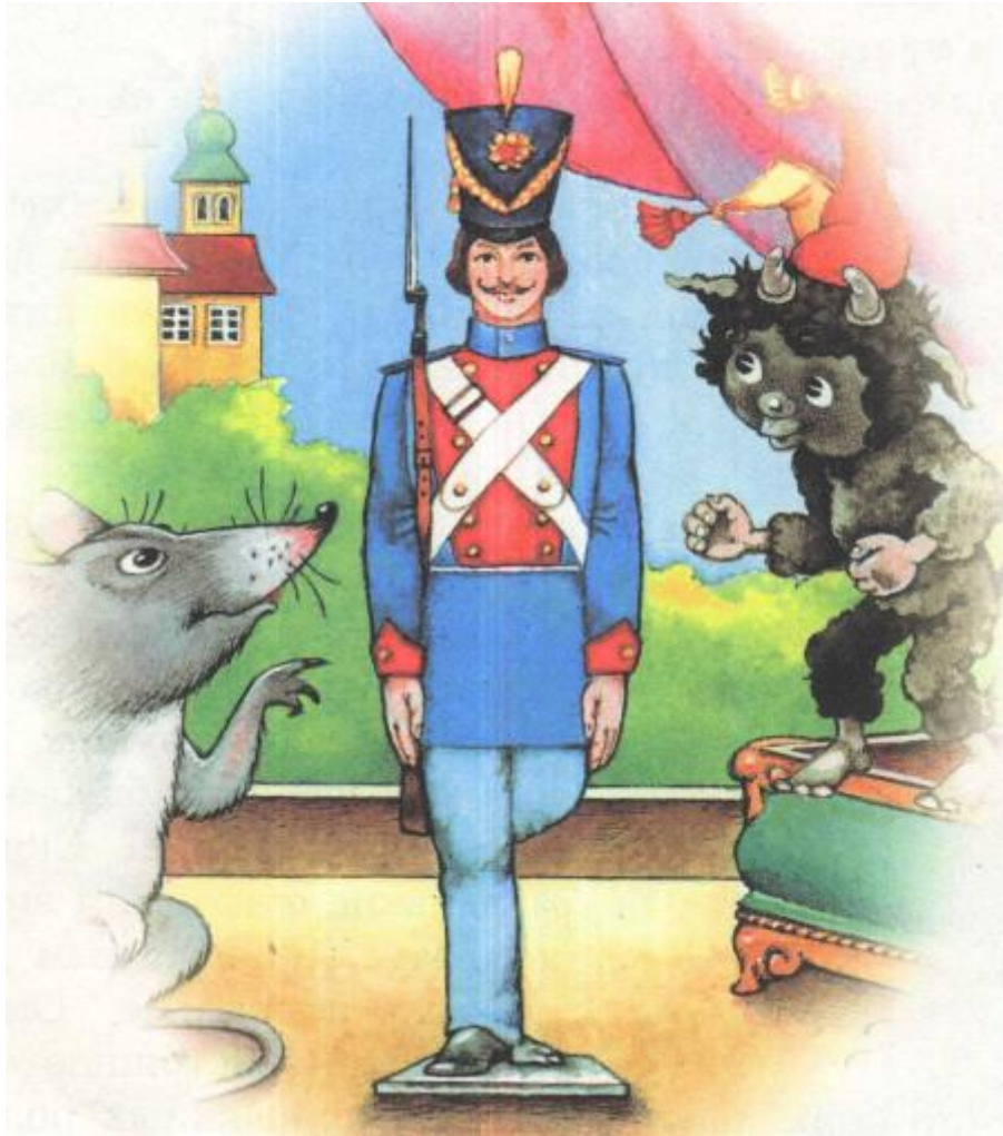
11 - Комната 5. Стойкий Оловянный Солдатик