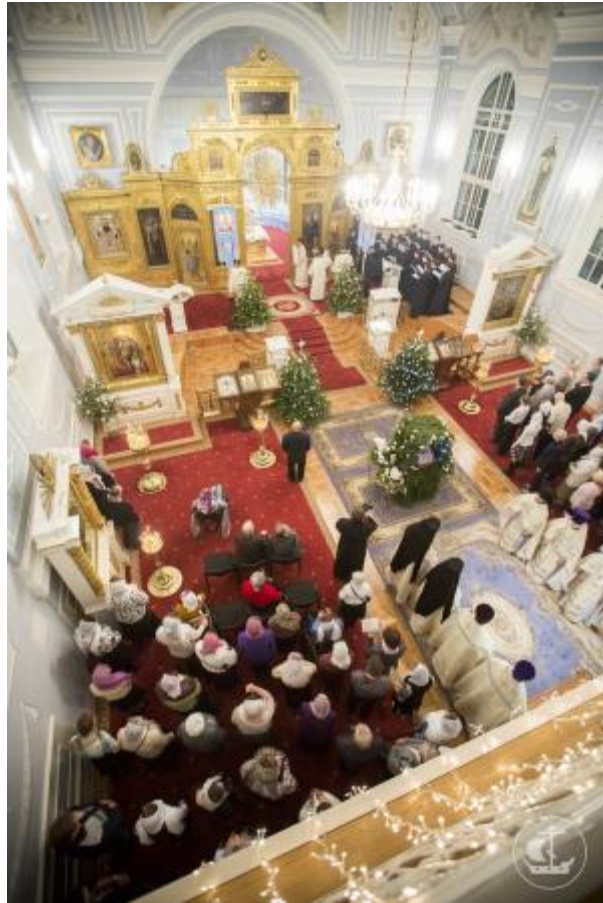
Наступило Рождество Христово. Много радости принесло оно детям и взрослым.