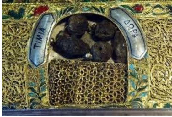
10 - СМИРНА