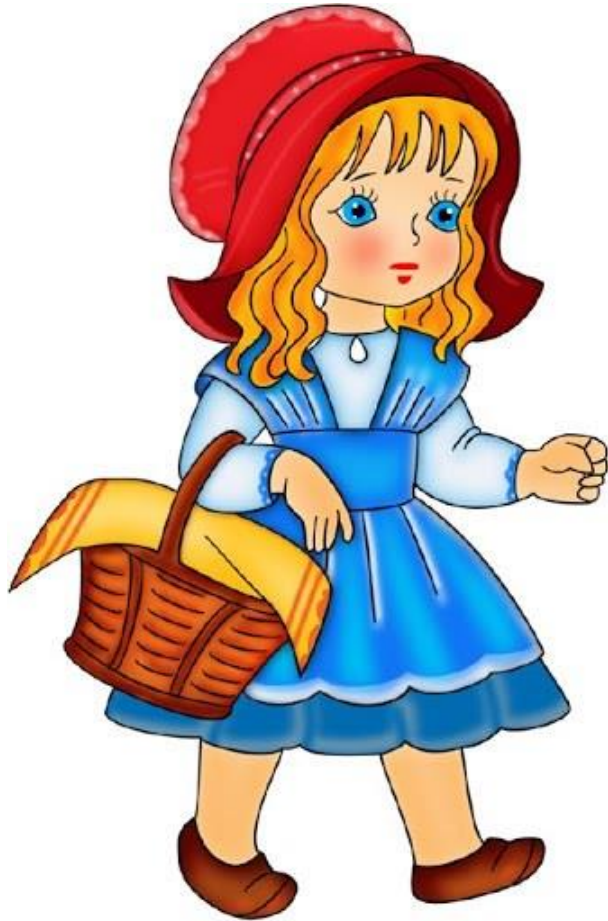
8 - КОМНАТА 4. Красная Шапочка

Эта девочка доброй была, С мамой вместе она жила, Она сказала мне в лесу: «Пирожки я бабушке несу».