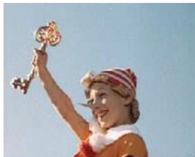
5 - Комната 3. Буратино